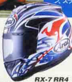
RX-7 RR4 McCOY ¥55,000