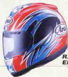
RX-7 RR4 EDWARDS ¥55,000