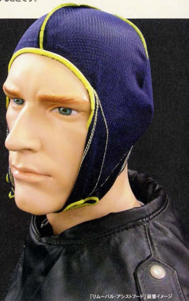
「リムーバル・アシストフード」装着イメージ