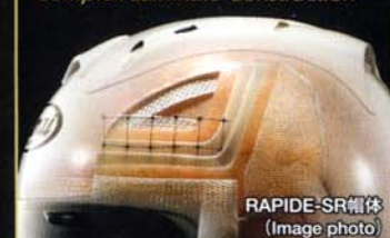
RAPIDE-SR帽体 (Image photo)

Peripherally Belted Complex Laminate Construction