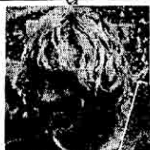
グラハム・ノイス選手 英国 79年500ccモトクロスGP世界チャンピオン。

80年は、モトクロスでも☉をかぶって活躍する人々を、日本で、世界で、御覧いただけるでしょう。御期待下さい。