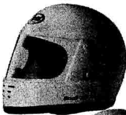
ラバイド XXL 色：白 サイズ：(63~64cm) (65cm) 価格：¥29,000