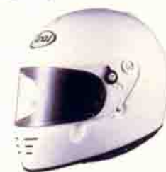
GP-K JR ¥30,000

難燃性布地を全面採用した国内格式のカーレース、カートレースに使用可能なJAF公認モデル。